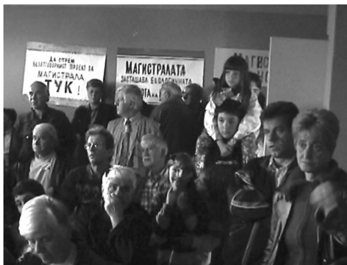
Снимка: За земята

Като резултат от тази непълна формулировка досега, участието на НПО бе оставено на благоволенieto на националните институции. По тази причина включването на НПО в управлението на фондовете варира значително в отделните страни членки. Докато някои органи гледат на принципа на партньорство сериозно и канят неправителствените органи-